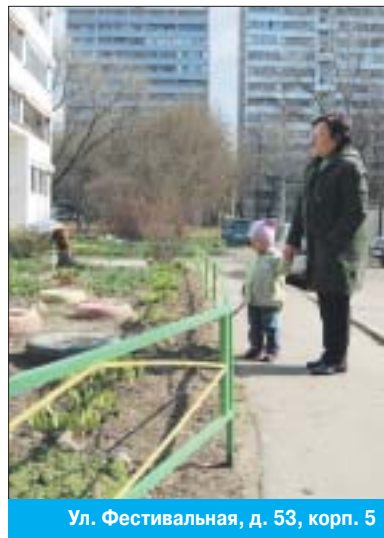
Ул. Фестивальная, д. 53, корп. 5

Конкурс по благоустройству «Московский дворик-2010» проводится по следующим номинациям: «Лучший московский дворик»; «Лучший двор, благоустроенный с активным участием жителей»; «Самый благоустроенный микрорайон столицы»; «Самая благоустроенная территория учреждений культуры»; «Самая благоустроенная территория предприятия»; «Самая благоустроенная территория вуза, колледжа»; «Самая благоустроенная территория спортив-