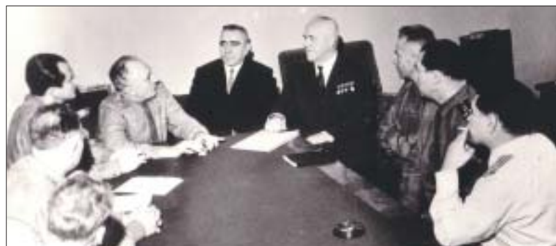
С Маршалом Советского Союза Г.К. ЖУКОВЫМ

Бывал в служебных командировках в США, Великобритании, ФРГ, Финляндии и в других странах, где выступал с лекциями, встречался с известными представителями элиты этих государств, в частности, с Генри Киссинджером и Маргарет Тэтчер.