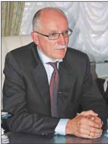
Уважаемые жители Северного округа!

По традиции в начале сентября москвичи отмечают День города. В этом году Первопрестольной исполнилось 865 лет.