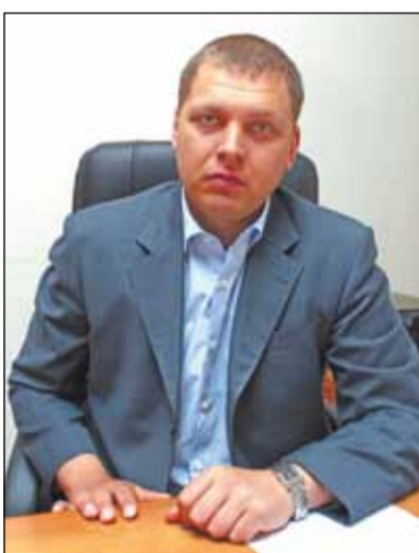
Уважаемые жители района Ховрино!

В. Н. СИЛКИН, префект Северного административного округа города Москвы