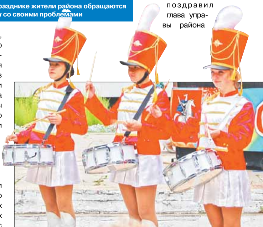
Особенно зрелищным стало выступление на празднике юных барабанщиц

С юбилеем Москвы жителей поздравил глава управы района