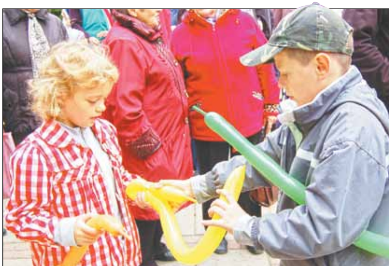
Программа Дня города была составлена так, чтобы занятие по душе нашли и взрослые, и дети