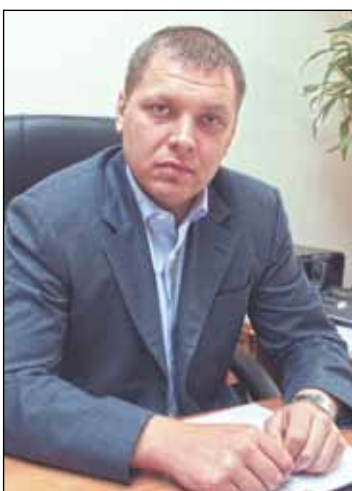
Уважаемые жители района Ховрино!

Сердечно поздравляю вас с Днем защитника Отечества! Этот праздник олицетворяет славу российского оружия, храбрость и честь воинов, защищающих свободу и независимость нашей Родины. В каждом доме, в каждой семье бережно хранят память о героизме дедов и отцов, гордятся теми, кто сегодня надежно обеспечивает безопасность нашей