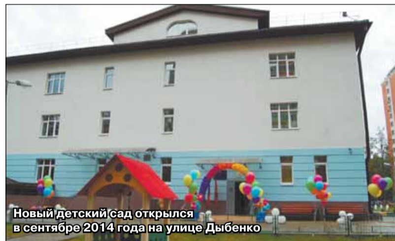
Новый детский сад открылся в сентябре 2014 года на улице Дыбенко